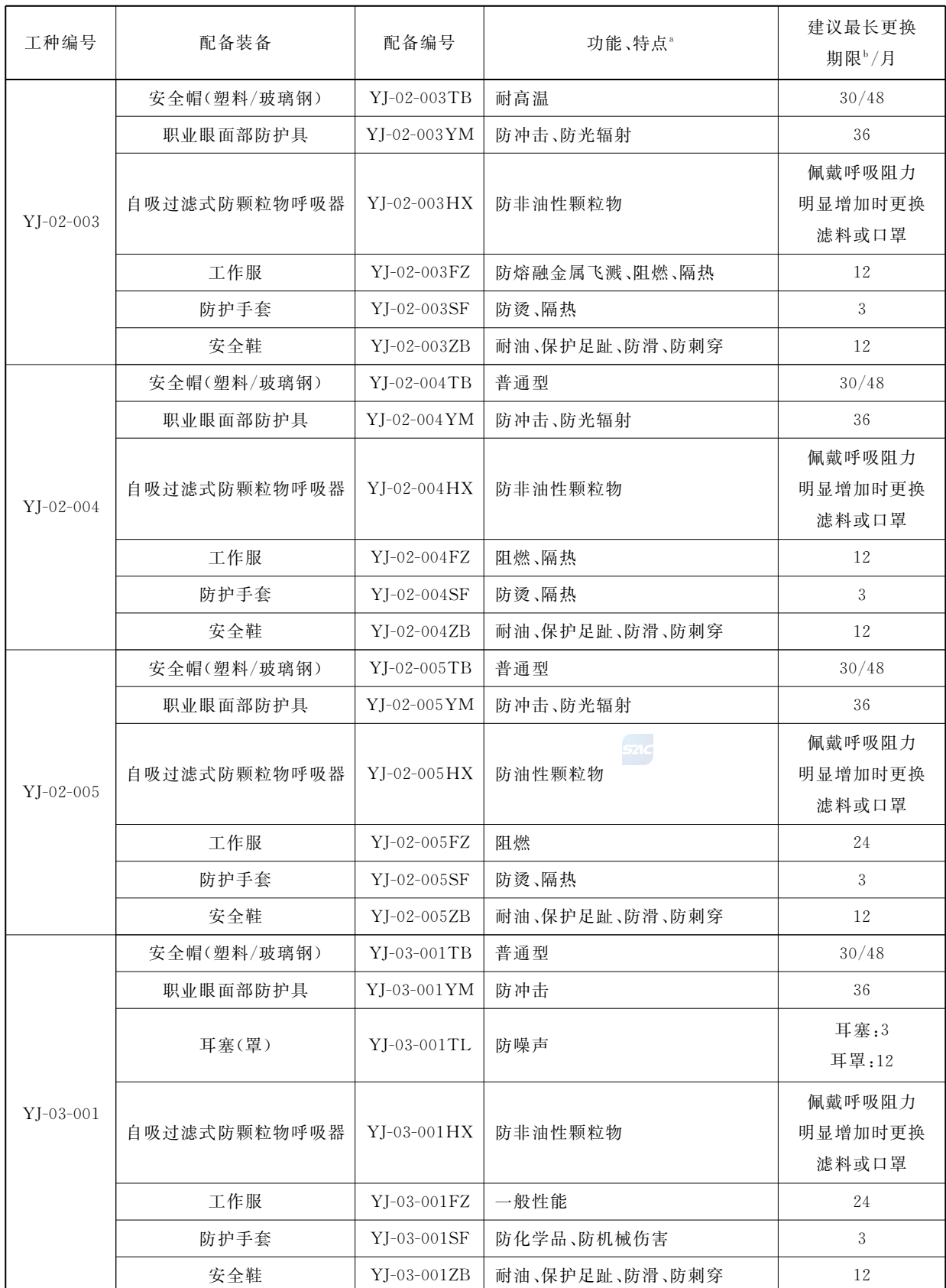
表 B.1 (续)